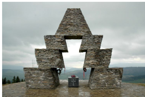
A magyar honfoglalás emlékműve a Vereckei-hágón