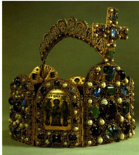
A német-római császári